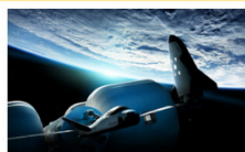
宇宙ステーション