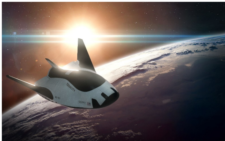
宇宙往還機 Dream Chaser イメージ

JAL、兼松、大分県、三菱 UFJ 銀行、東京海上日動、Sierra Space、Space Port Japan は、宇宙往還機 Dream Chaser®の活用検討に向けたパートナーシップ契約を締結しており、各者の連携のもと、大分空港を Dream Chaser のアジア拠点として活用することを目指し、実現に向けた取り組みを推進しています。